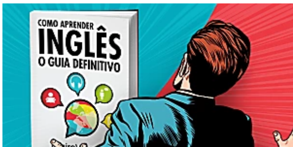
Ebook que antes era vendido é distribuído 100% grátis! Mairo Vergara