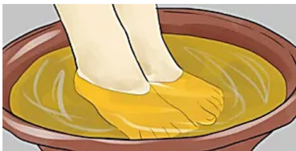
Esta Mulher 'Tratou' Os Seus Fungos Nas Unhas Em 10 Minutos, Veja Agora healthnewstips.today