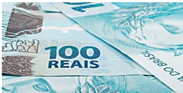
Como você viveria com 100% do seu salário livre? Empiricus