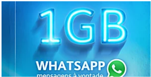
Já conhece as ofertas do TIM pré? TIM