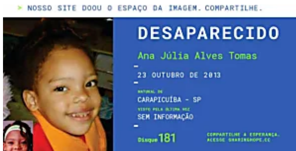
Ação voltada para sites ajuda a encontrar pessoas desaparecidas