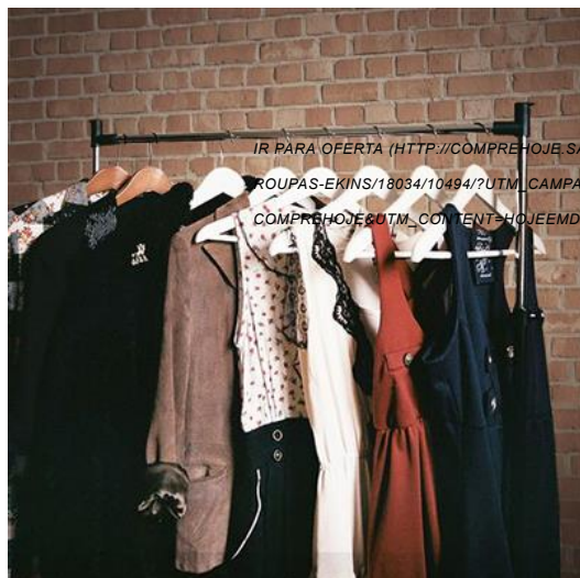
Arara de Roupas Desmontável com Sapateira - Ekins

IR PARA OFERTA ( HTTP://COMPREHOJE.SAFARISHOP.COM.BR/PRODUTO/ARARA-DE-ROUPAS-EKINS/18034/10494/?UTM_CAMPAIGN=SAFARISHOP-COMPREHOJE&UTM_CONTENT=HOJEEMDIA_SHOP_SITE_18034_10494_27072017&UTM_SOURCE=HOJEEMDIA&UTM_MEDIUM=WEB&UTM_TERM=OFF01 )