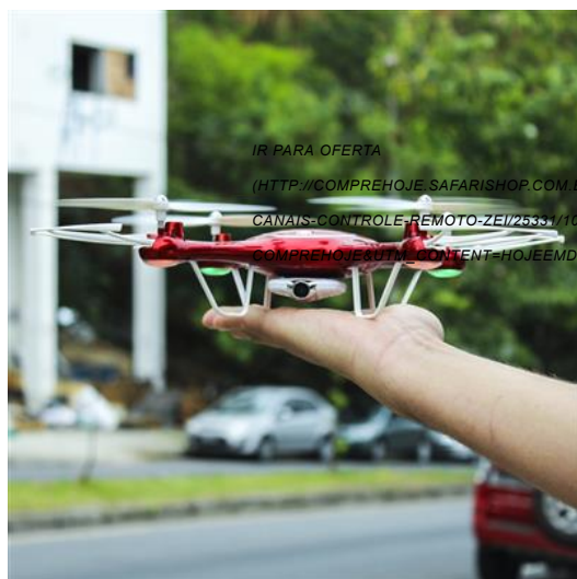
Quadróptero Drone com Câmera Wifi 4 canais Controle Remoto

IR PARA OFERTA ( HTTP://COMPREHOJE.SAFARISHOP.COM.BR/PRODUTO/ARARA-DE-ROUPAS-EKINS/18034/10494/?UTM_CAMPAIGN=SAFARISHOP-COMPREHOJE&UTM_CONTENT=HOJEEMDIA_SHOP_SITE_18034_10494_27072017&UTM_SOURCE=HOJEEMDIA&UTM_MEDIUM=WEB&UTM_TERM=OFF01 )