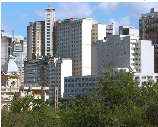
EMPENAS – Do mirante da rua Sapucaí, avistam-se diversas laterais cegas