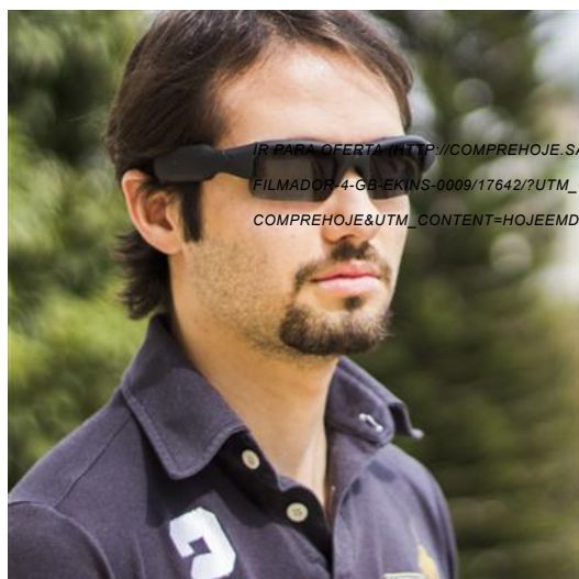
Óculos de Sol Filmador 4GB PRO – Ekins

IR PARA OFERTA ( HTTP://COMPREHOJE.SAFARISHOP.COM.BR/PRODUTO/QUADRICOPTERO-DRONE-4-CANAIS-CONTROLE-REMOTO-ZEI/25331/10031/?UTM_CAMPAIGN=SAFARISHOP-COMPREHOJE&UTM_CONTENT=HOJEEMDIA_SHOP_SITE_25331_10031_27072017&UTM_SOURCE=HOJEEMDIA&UTM_MEDIUM=WEB&UTM_TERM=OFF01 )