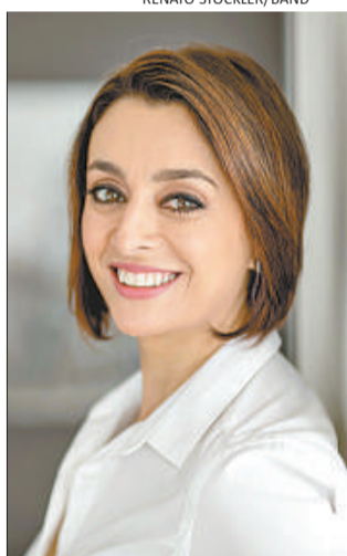
Cátia Fonseca fala sobre saúde e beleza no Melhor da tarde , na Band