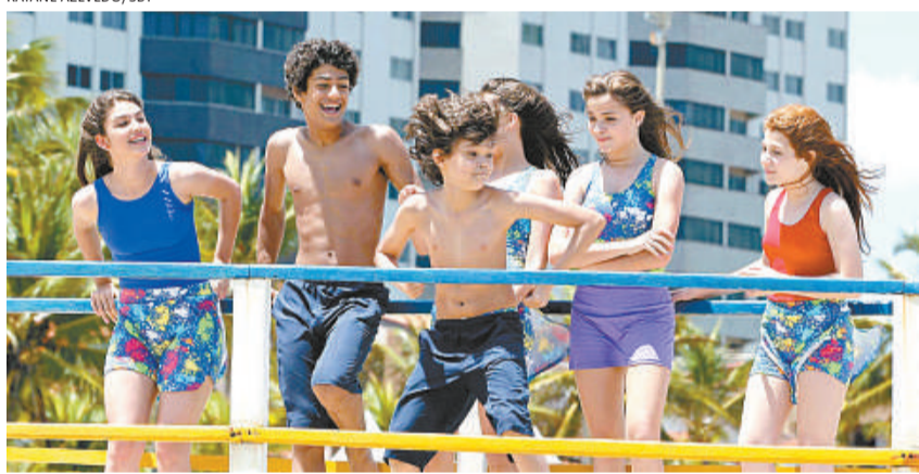
Novela teen Chiquititas , atração do SBT/Alterosa