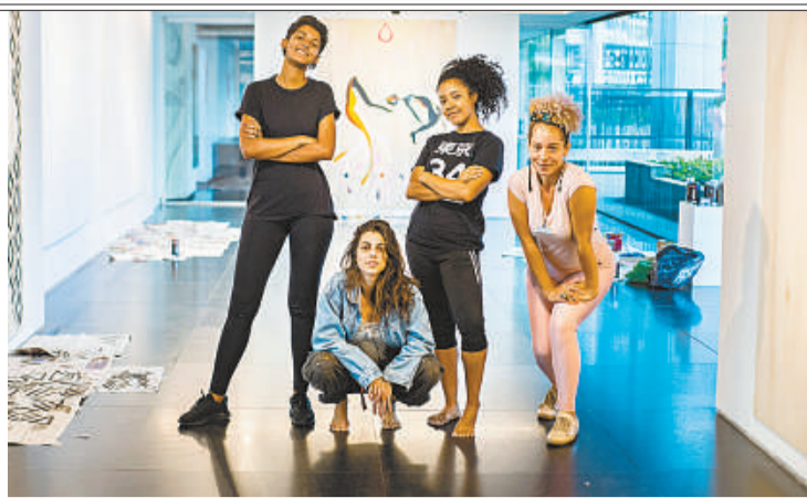
ÁREA DE SERVIÇO/DIVULGAÇÃO